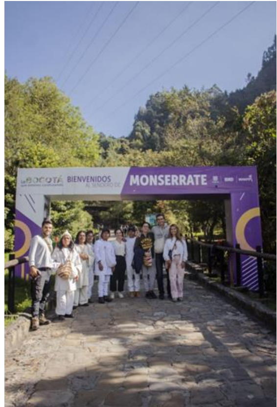
Figura No. 4.

Los dos mamos subieron hasta Monserate e hicieron pagamento, y poco después comenzó a llover fuertemente.