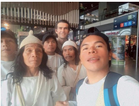
Figura No. 1. Bolaño, L. (12- 2023)

Stéphane Labarthe nos recibió amablemente en el Aeropuerto Internacional El Dorado y nos llevó a su casa.