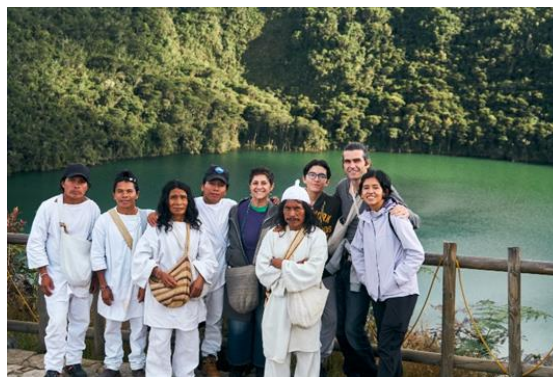
Figura No. 2.

Antes de dirigirnos allí, consultamos y preparamos una ofrenda para presentarla en la laguna de Guatavita para la conexión con el esuama de Suldibaxe [8] . Esta laguna es fundamental para asuntos importantes. Durante nuestra