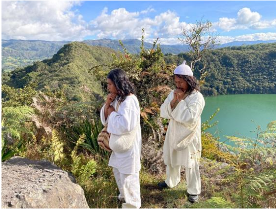
Figura No. 3.

esuamas como: Suldibaxe, Magutama y Nuabaxa.